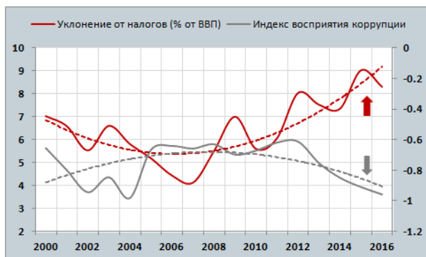
Фигура 3. Связь между уровнем коррупции (правая ось) и уклонением от уплаты налогов в Республике Молдова (левая ось)