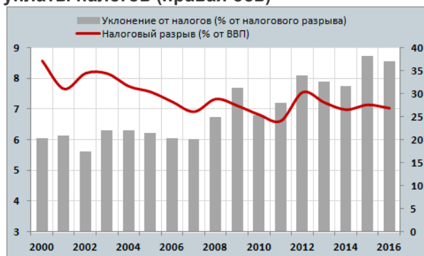
Фигура 4. Динамика совокупного налогового разрыва (левая ось) и разрыва, обусловленного уклонением от уплаты налогов (правая ось)